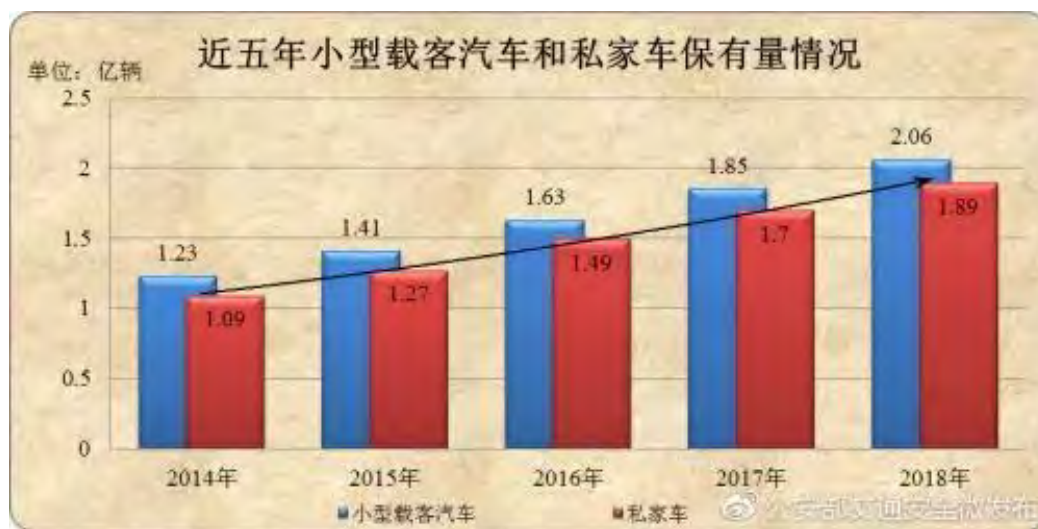
近五年小型载客汽车和私家车保有量情况近五年小型载客汽车和私家车保有量情况

据公安部交管局统计，截至 2018 年底，全国新注册登记机动车 3172 万辆，全国机动车保有量已达 3.27 亿辆。2018 年，全国机动车驾驶人数量达 4.09 亿人，其中汽车驾驶人达 3.69 亿人，近五年全国机动车驾驶人数量呈现持续大幅增长趋势，年均增量达 3012 万人。